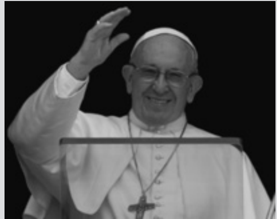
El Pontífice en un momento durante el Ángelus

Procedentes de las más de doscientas diócesis de toda Italia, decenas de miles de jóvenes se pondrán en camino a pie en la primera semana de