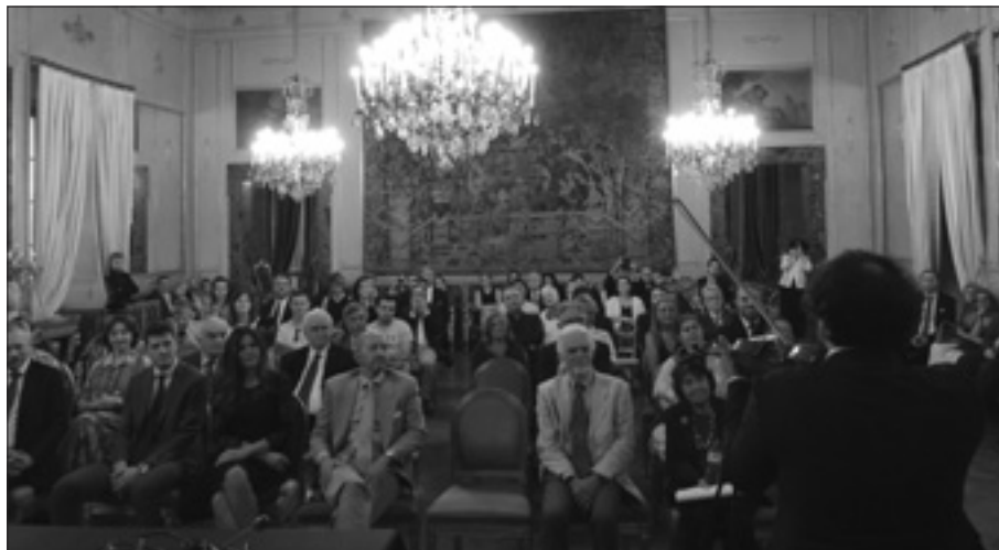
Actuación del violinista albanés Olen Cesari durante la conferencia

Conferencia sobre el rey Alfonso de Aragón y el héroe albanés Skënderbeu