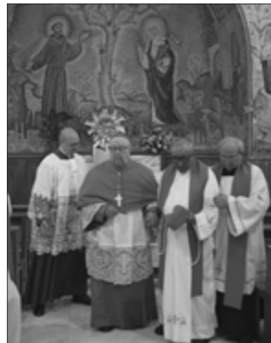
El cardenal Sergio Obeso Rivera durante la ceremonia de posesión con el título de San León I (01/07/2018)