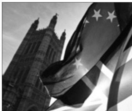
Si parla di un piano per tutelare i reali in caso di disordini