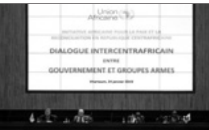
Riunione a Khartoum il 24 gennaio

I negoziati di Khartoum lanciati a fine gennaio su iniziativa dell'Unione africana e dell'Onu hanno riunito allo stesso tavolo di lavoro i gruppi armati e una importante delegazione del governo. Giovedì scorso i colloqui erano stati momentaneamente sospesi a causa di importanti discorsi su alcuni punti, in particolare la questione dell'amnistia dei responsabili di crimini e sevizie.