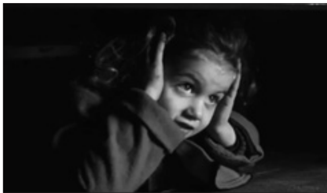
Una scena del film «Schindler's List»

Una riflessione a partire dalla bambina protagonista del film «Schindler's List»