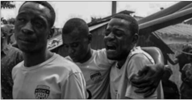
La Chiesa in Zimbabwe cerca di mediare fra governo e chi protesta per il caro-benzina