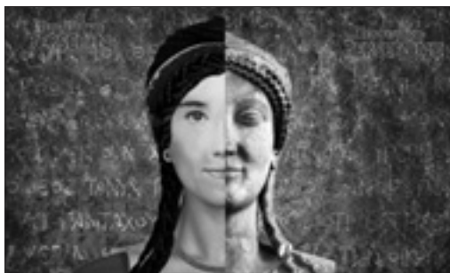
Persefone in un'elaborazione grafica del Museo ipogeo spartano di Taranto