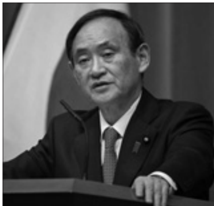
Il segretario generale del governo nipponico, Yoshihide Suga

Il trattato Inf venne siglato a Washington l'8 dicembre del 1987 tra l'allora presidente degli Stati Uniti, Ronald Reagan, e il leader russo, Michail Gorbaciov, e proibiva lo sviluppo e lo spiegamento dei missili con raggio d'azione tra 500