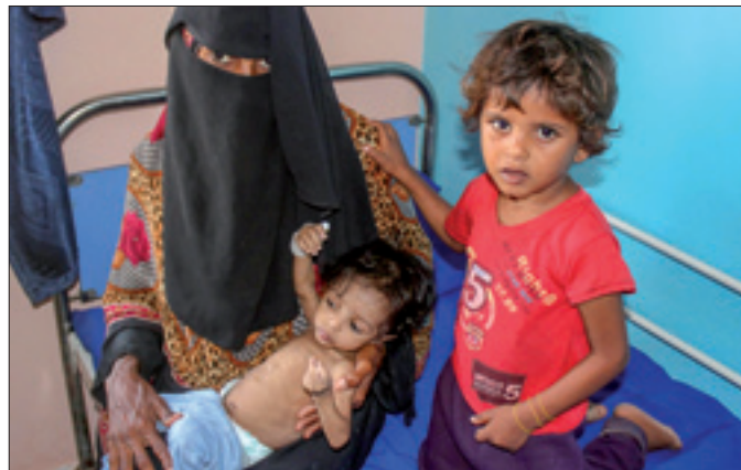
Bambini yemeniti in un pronto soccorso a Hodeida

Anche oggi, il mondo ha bisogno di vedere nei discepoli del Signore dei profeti, cioè delle persone coraggiose e perseveran-