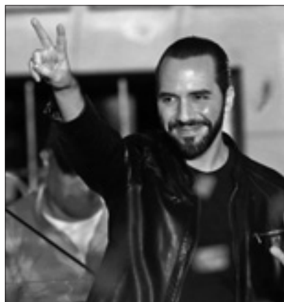
Il nuovo presidente Nayib Bukele

SAN SALVADOR, 4. L'ex sindaco della capitale, il trentasettenne Nayib Bukele, ha vinto al primo turno le elezioni presidenziali in Salvador. I risultati finora disponibili gli assegnano il 53,83 per cento dei consensi.