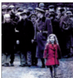
Una riflessione a partire dalla bambina protagonista del film «Schindler's List»

della violenza compiuta in nome di Dio, ma dove si fanno affermazioni importanti e vincolanti che riguardano l'islam e certe sue interpretazioni. Sono impegnative le parole riguardanti il rispetto per i credenti di fedi diverse, la condanna di ogni discriminazione, la necessità di proteggere tutti i luoghi di culto e il diritto alla libertà religiosa, come pure il riconoscimento dei diritti delle donne. È significativa anche la sottolineatura riguardante una delle radici più profonde del terrorismo nichilista, che trae origine dalle interpretazioni errate dei testi religiosi ma anche da un «deterioramento dell'etica, che condiziona l'agire internazionale, e un indebolimento dei valori spirituali e del senso di responsabilità». Elementi che favoriscono frustrazione e disperazione, «scondendo molti a cadere o nel vortice dell'estremismo ateo e agnostico, oppure nell'integralismo religioso, nell'estremismo e nel fondamentalismo cieco». Occidente e Oriente, credenti di religioni diverse che guardano gli uni agli altri come fratelli - dichiarano il Vescovo di Roma e il Grande Imam di Al-Azhar - possono aiutarsi a vicenda per cercare di evitare che la guerra mondiale a pezzi deflagri in tutta la sua distruttiva potenza.