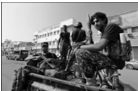
Ribelli huthi a Hodeidah

Ieri sera invece, per la prima volta dopo settimane, le parti belligeranti si sono incontrate nel contesto e strategico porto di Hodeidah, sul Mar Rosso. Al centro del faccia a faccia, sempre mediato dalle Nazioni Unite, i meccanismi per garantire il disimpegno militare del porto, da dove transita circa l'80 per cento degli aiuti umanitari diretti alla popolazione del paese, devastato da oltre tre anni e mezzo di combattimenti e da una dilagante carestia.