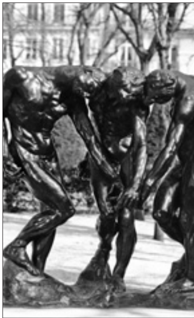
Auguste Rodin «Le tre ombre» (1897)