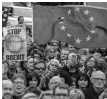
Un momento del corteo a Londra per un nuovo referendum sulla Brexit

I media britannici hanno sottolineato che per ricordare in riva al Tamigi folle più oceaniche bisogna risalire all'epoca della guerra in Iraq, alle proteste - con un milione di persone - contro l'intervento voluto dal governo di Tony Blair.