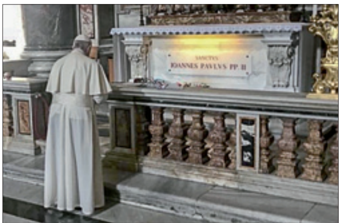
Nella mattina di lunedì 22 ottobre, memoria liturgica di san Giovanni Paolo II e quarantesimo anniversario dell'inizio del suo pontificato, Papa Francesco si è recato nella basilica vaticana per pregare davanti alla tomba del predecessore

Sua Eccellenza Monsignor Miguel Ángel Ayuso Guixot, Vescovo titolare di Lupercina, Segretario del Pontificio Consiglio per il Dialogo Interreligioso.