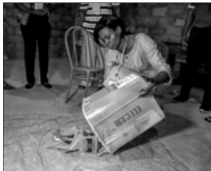
Per contestare lo scrutinio del 7 ottobre