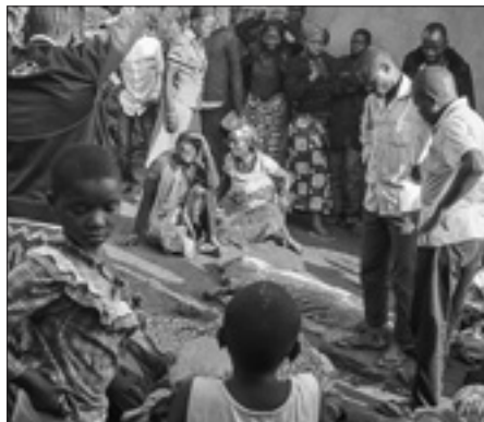
Una vittima delle Adf circondata dai suoi familiari

KINSHASA, 22. La folla ha saccheggiato domenica gli edifici pubblici a Beni, nell'est della Repubblica Democratica del Congo, all'indomani di un attacco di ribelli ugandesi costato la vita ad almeno undici persone. Altre quindici, tra cui dieci bambini, sono stati rapiti. «Abbiamo appena raccolto undici corpi di civili uccisi e «mancano quindici persone tra cui dieci bambini, la cui età varia tra cinque e dieci anni», ha dichiarato il colonnello Safari Kazungufu, capo della polizia di Beni. Questo bilancio potrebbe essere più elevato perché alcuni civili hanno riferito di avere visto altri cadaveri nel quartiere dove si è svolto l'attacco. L'azione armata è stata «probabilmente condotta dai ribelli appartenenti alle Forze democratiche alleate (Adf) che minacciano la città di Beni». Lo ha dichiarato all'agenzia France-Presse il portavoce dell'esercito nella regione, il capitano Mak Hazukay. «Successivamente la popolazione ha reagito e ha percorso le strade mostrando i corpi di tre civili uccisi a Boikene», un quartiere