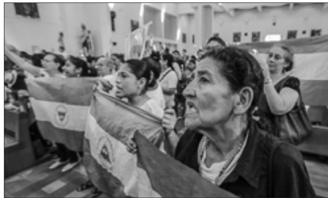
Nella cattedrale di Managua