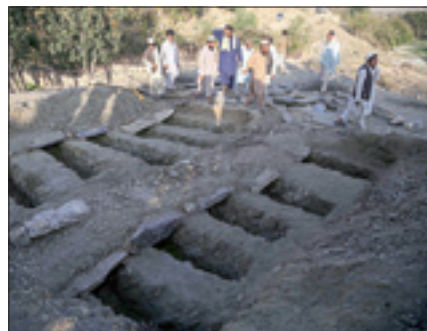
Seppellimento delle vittime dell'attentato avvenuto nel distretto di Adin

KABUL, 22. Come purtroppo si temeva, le attese elezioni legislative in Afghanistan sono state contraddistinte da una lunga scia di sangue. Durante tutta la campagna elettorale, e alla vigilia dell'apertura dei seggi, i talebani hanno minacciato di morte chiunque si fosse recato a votare.