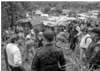
Soccorritori a Barrancabermeja

BOGOTÀ, 22. Una frana si è abbattuta ieri su quattro case di un quartiere di Barrancabermeja, nel dipartimento colombiano di Santander, causando la morte di almeno nove persone. Lo ha reso noto il comandante dei vigili del fuoco della città. «Sfortunatamente - ha spiegato Alexander Diaz - l'incidente è avvenuto attorno alle 6 del mattino, mentre gli abitanti delle case ancora dormivano». Le cause, ha aggiunto, vanno ricercate «nelle piogge battenti degli ultimi giorni». Tra le vittime, precisano le autorità locali, figurano quattro adulti e cinque bambini, mentre i soccorritori sono impegnati nella ricerca di una decima persona che risulta al momento dispersa. Il quartiere della tragedia è abitato da famiglie molto povere che vivono sul fianco di una collina in baracche di legno e di lamiera.