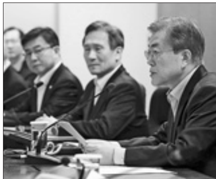
Sale la tensione nella penisola coreana