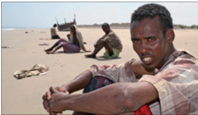
Migranti somali sulla spiaggia yemenita dopo la traversata del golfo di Aden

SANA'A, 10. Una nuova tragedia dell'immigrazione è avvenuta oggi al largo delle coste yemenite, nel golfo di Aden. Circa 180 migranti sono stati costretti dai trafficanti a gettarsi in mare dal barcone su cui viaggiavano. Scappavano dal Corno d'Africa verso lo Yemen. Lo rende noto l'Organizzazione internazionale per la migrazione (Oim), affermando che i dispersi sono almeno cinquanta e che al momento sono stati recuperati soltanto cinque corpi. Questa nuova tragedia avviene a meno di 24 ore di distanza da un altro terribile episodio. Ieri i trafficanti hanno costretto oltre 120 persone, tra cui soprattutto ragazzi, a gettarsi in mare. La motivazione del gesto dei trafficanti sembra essere la stessa, in entrambi i casi: avevano avvistato la polizia yemenita.