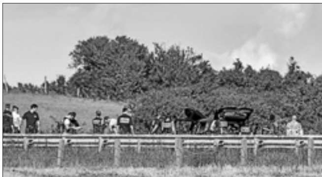
La macchina dell'attentato contro i militari al momento del fermo da parte della polizia

Secondo alcune parti politiche non sono accettabili, mentre il governo parla di interventi nell'ambito di un'ottimizzazione delle risorse.