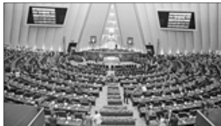
Il parlamento iraniano durante la cerimonia di insediamento del presidente Rohani