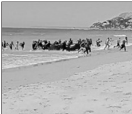
Sbarchi di migranti tra i turisti a Cadice in Spagna

La Spagna teme di diventare il nuovo paese di approdo delle migliaia di migranti che dalla costa del Nord Africa tentano di attraversare il Mediterraneo per arrivare in Europa. Dall'inizio dell'anno sono più di 6000 gli arrivi, raddoppiati rispetto all'anno precedente. L'aumento è stato parallelo, nei mesi di giugno e di luglio, alla diminuzione di arrivi