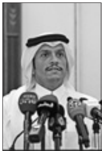
Il ministro degli esteri del Qatar Al Thani

Centinaia di civili feriti o malati restano senza alcun tipo di assistenza