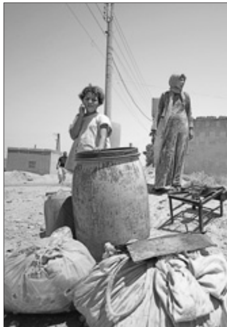
Civili siriani in fuga da Raqqa

La cronaca conferma tragicamente la veridicità di questa testimonianza. Ieri, un raid attribuito alla coalizione internazionale a guida statunitense ha causato 22 morti, la maggiore parte dei quali civili inermi. Nella città e nel territorio circostante le milizie dell'Is continuano a combattere, anche se hanno perso molto terreno e sono in ritirata.