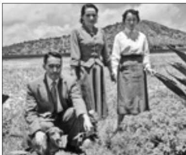
Romero con le sorelle prima di entrare in seminario

Senza dubbio la storia della Chiesa ringrazierà monsignor Romero per la sua difesa tenace dell'aspetto più trascendente che sfiora il mistero di Dio: la vita umana nelle sue sorgenti, nel suo corso e nella sua fine. «Se mi uccidono, risusciterò nella lotta del popolo salvadoregno». Oggi è evidente che questa profezia non era una semplice metafora occasionale, ma l'espressione di una conoscenza reale del popolo di Dio.