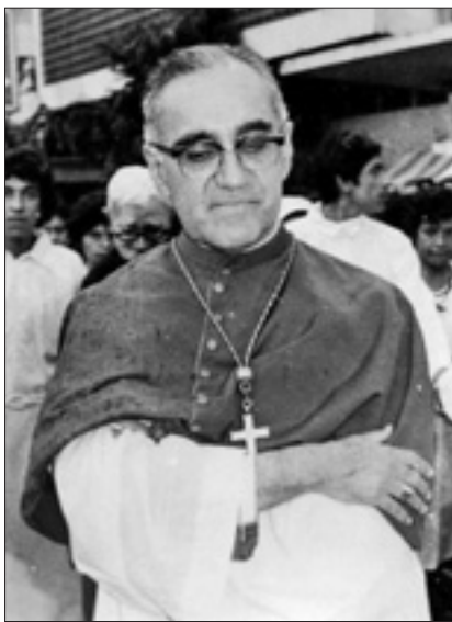
Monsignor Romero nel 1979