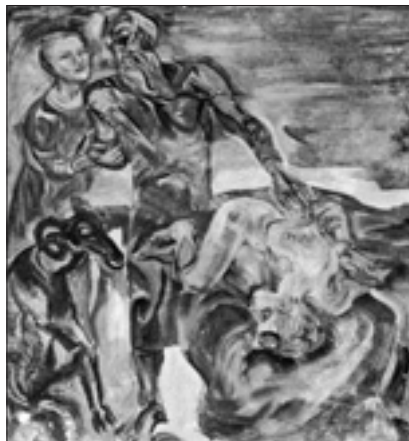
Nils Sparari «Abramo e Isacco» (1969)

Tale consapevolezza della dimensione divina dell'uomo sarà poi alla base dell'umanesimo ebraico sviluppato dal pensiero ebraico post kantiano. L'uomo, la sua mente e struttura potenziale contengono in sé questa dimensione divina universale capace di ragionare e trovare una morale e un modo di ragionare universale. Lo stesso mito dell'immagine divina contenuta nell'uomo creato sarà poi alla base di sviluppi successivi della teologia e dell'antropologia cristologica. Alla base